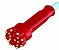
Cubex #21 Pin mit Spline

ROCKMORE INTERNATIONAL Rock Drilling Tools